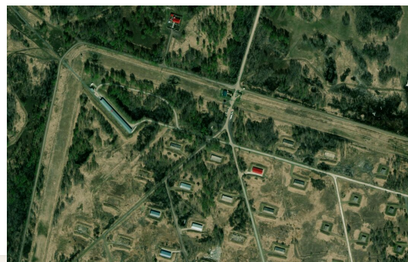
North-East part: 55.0949,80.7837