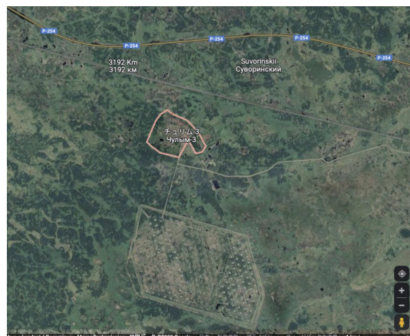
Чулым-3 and Chulym arsenal