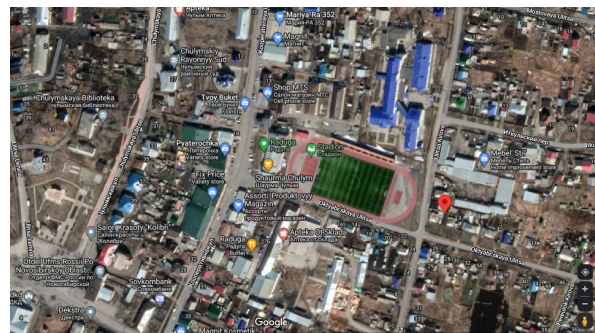
Чулымский р-н, Чулым-3, Октябрьская ул., д.1